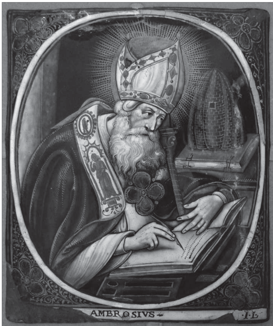
Jacques I Laudin (1627–1695): Svatý Ambrož; glazovaná měď, Musée de Châlons en Champagne, Remes, Francie (zdroj: Wikimedia Commons)

Obrázek, jak takové traditio symboli v Miláně vypadalo, nabízí Ambrožův spisek Explanatio symboli . Stylově se nejedná o žádnou řečnickky vybroušenou promluvu, ale o velmi osobní a prostou katechezi, již mohl pochopit každý kandidát křtu. Vyznání víry, jež se katechumenům při této příležitosti předávalo, stručně shrnuje zásadní články víry, aby ji pokřtěný mohl při křtu vyznat a po zbytek života zachovávat a obnovovat. 13 Nejedná se proto o ledajakou víru, ale o víru založenou na učení apoštolů; v Miláně se předávalo tzv. apoštolské vyznání víry, tedy vyznání římské církve. Obsah této víry je tedy jasně vymezen a kromě toho předán také ve stručné, snadno zapamatovatelné podobě. 14 Apoštolské vyznání víry vykládá biskup, nástupce apoštolů s odkazem na apoštolskou tradici a společenství s římskou církví – i to je velmi výmluvný moment v procesu předávání víry.