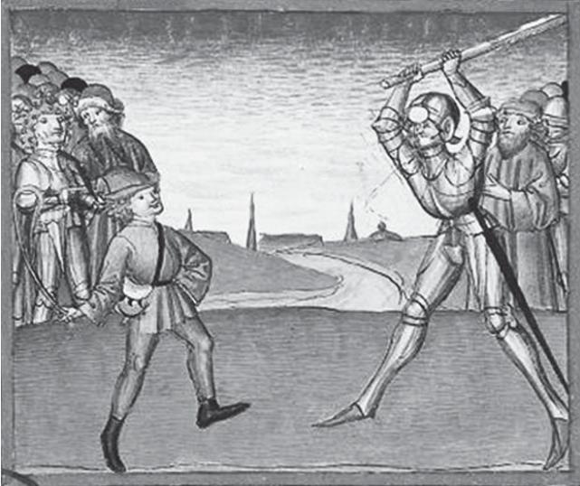
David a Goliáš. Ilustrace ze středověkého rukopisu Die Codices Palatini germanici v univerzitní knihovně v Heidelbergu.